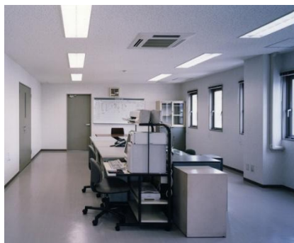
事務所 (写真:弊社本社)