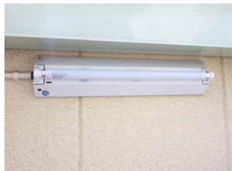
階段の非常灯