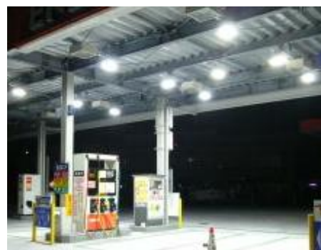
ガソリンスタンド