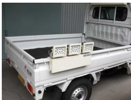
荷台サイド設置事例