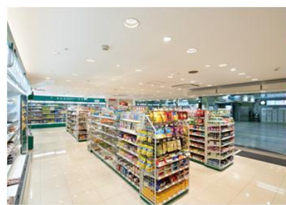
スーパーの商品照明