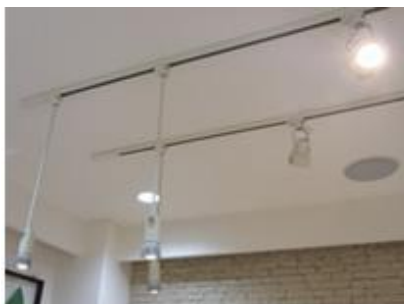
配線ダクトからの吊り下げ